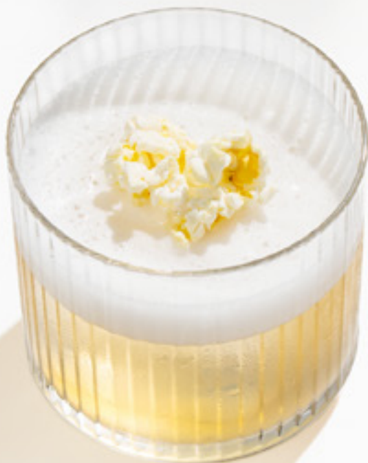
NEW Corn non/alco Корн б/алко виски б/а, кордиал попкорн, кордиал липа, попкорн, лимонный сок 440