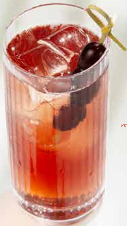
NEW Uva non/alco Ува б/алко вермут б/а, кордиал виноград-жасмин, тоник, жасминовый чай 460