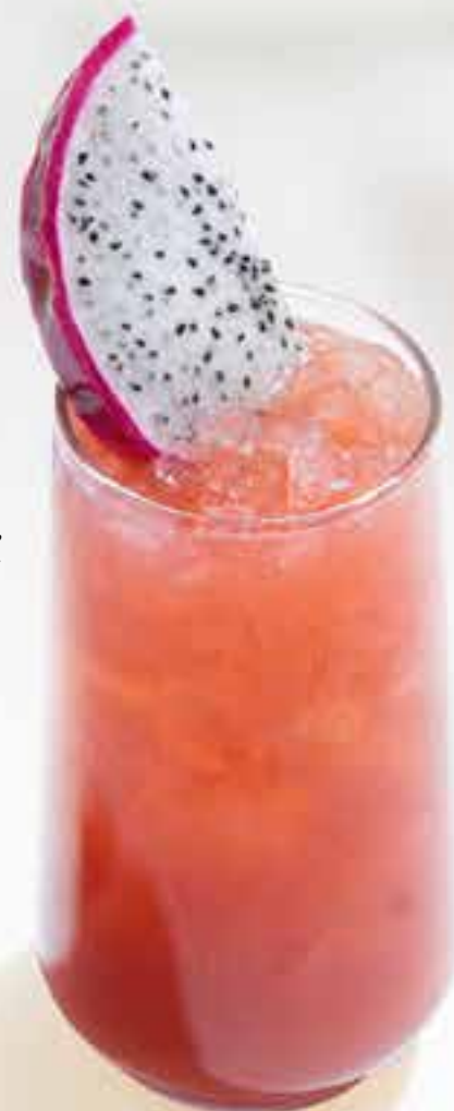
Lychee-blackberry Личи-ежевика личи, ежевика, кокос, лайм, лимон, содовая