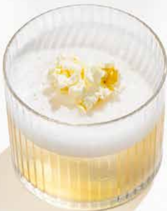
NEW Corn non/alco Корн б/алко виски б/а, кордиал попкорн, кордиал липа, попкорн, лимонный сок 440