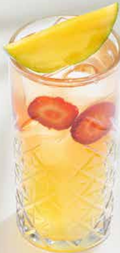
Mango-jasmine Манго-жасмин манго, жасминовый чай, клубника, кордиал манго-маракуйя-кокос 0,45 л/0,9 л 390/720