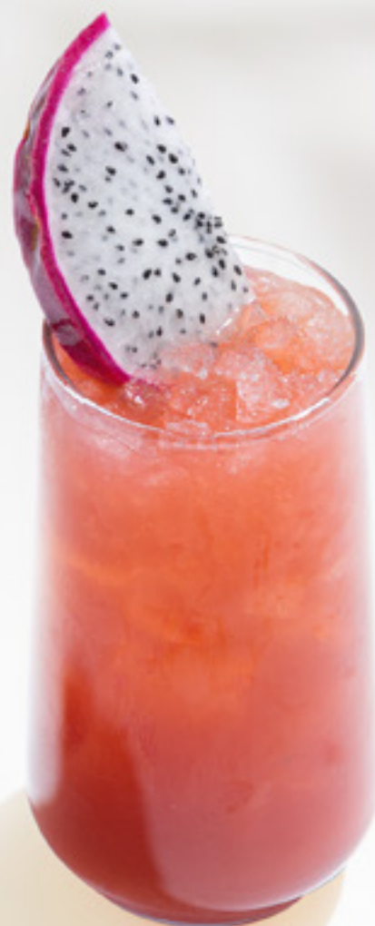
Lychee-blackberry Личи-ежевика личи, ежевика, кокос, лайм, лимон, содовая