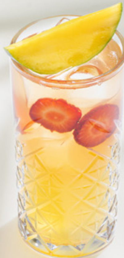
Mango-jasmine Манго-жасмин манго, жасминовый чай, клубника, кордиал манго-маракуйя-кокос