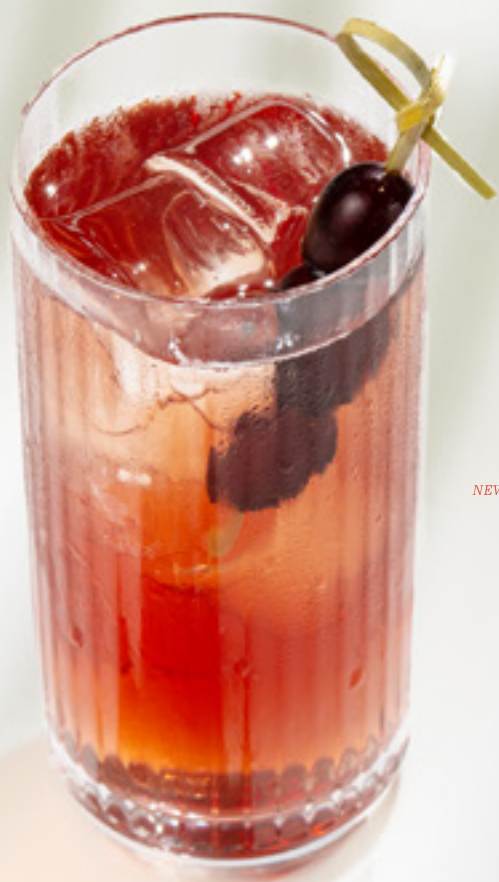
NEW Uva non/alco Ува б/алко вермут б/а, кордиал виноград-жасмин, тоник, жасминовый чай 460